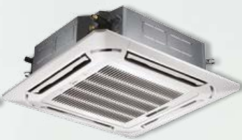
Cassette Oasis 24, 36 et 48