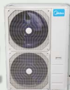
Unité extérieure 48