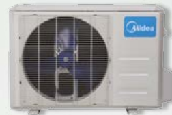
Unité extérieure 12 et 18