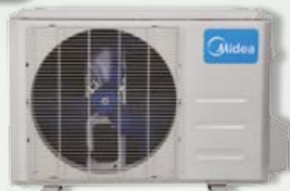
Unité extérieure 12 et 18