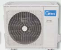
Unité extérieure 24, 30 et 36