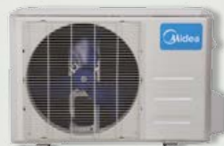
Unité extérieure 12 et 18