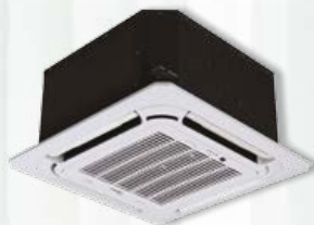
Cassette Oasis 12 et 18