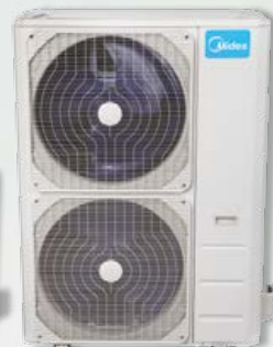
Unité extérieure 48