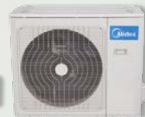
Unité extérieure 24, 30 et 36