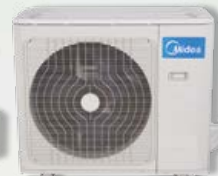
Unité extérieure 24, 30 et 36